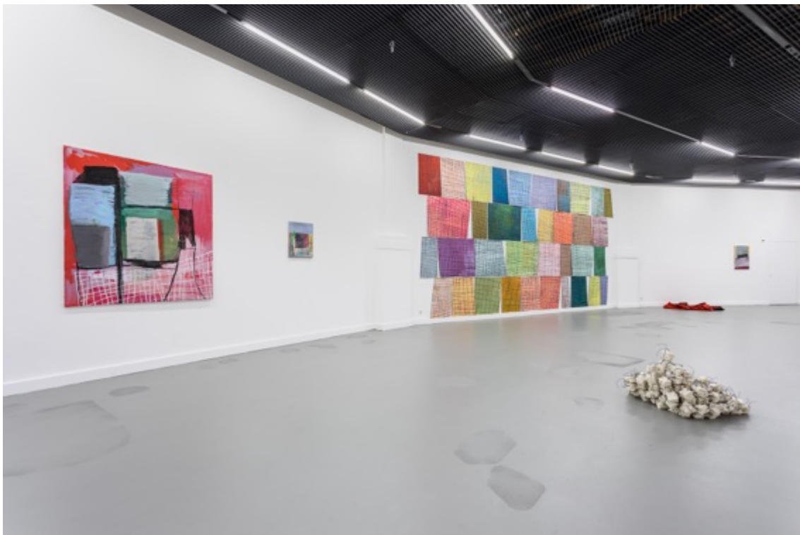
Ausstellungsansicht Kunsthalle Luzern, «Anna Margrit Annen – weit»