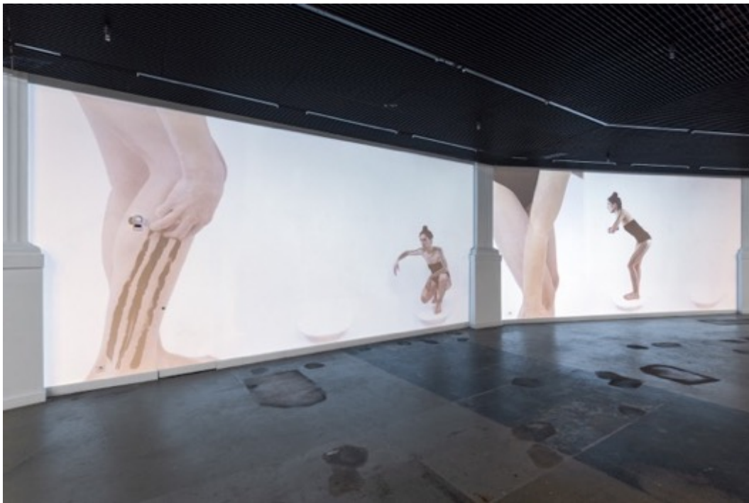
Ausstellungsansicht Kunsthalle Luzern, «Lotta Gadola – Traces in Sight», Fotocredits: Kilian Bannwart