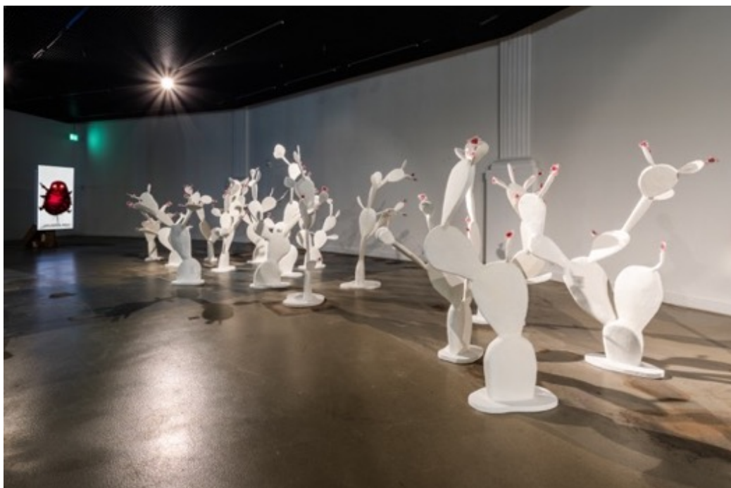
Ausstellungsansicht Kunsthalle Luzern, «Badel/Sarbach – Planty of Love»

Badel/Sarbach (Flurina Badel & Jérémie Sarbach)